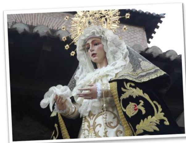
Ntra Sra. de la Soledad entrando en su Ermita en Barajas

Pdta: Aprovechando mi visita a Barajas visité su parroquia de S. Pedro. Me lleve una excelente sorpresa....pero ya os lo contaré otro día.